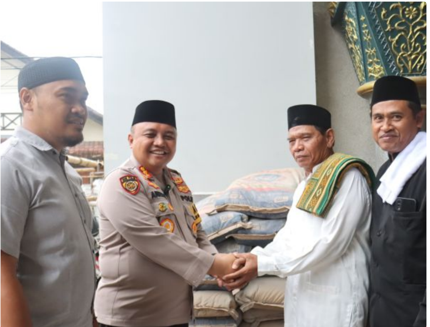
Kapolresta Mataram saat menyerahkan bantuan Semen di Masjid Al, Ikhlas, Jumat (06/12/2024)